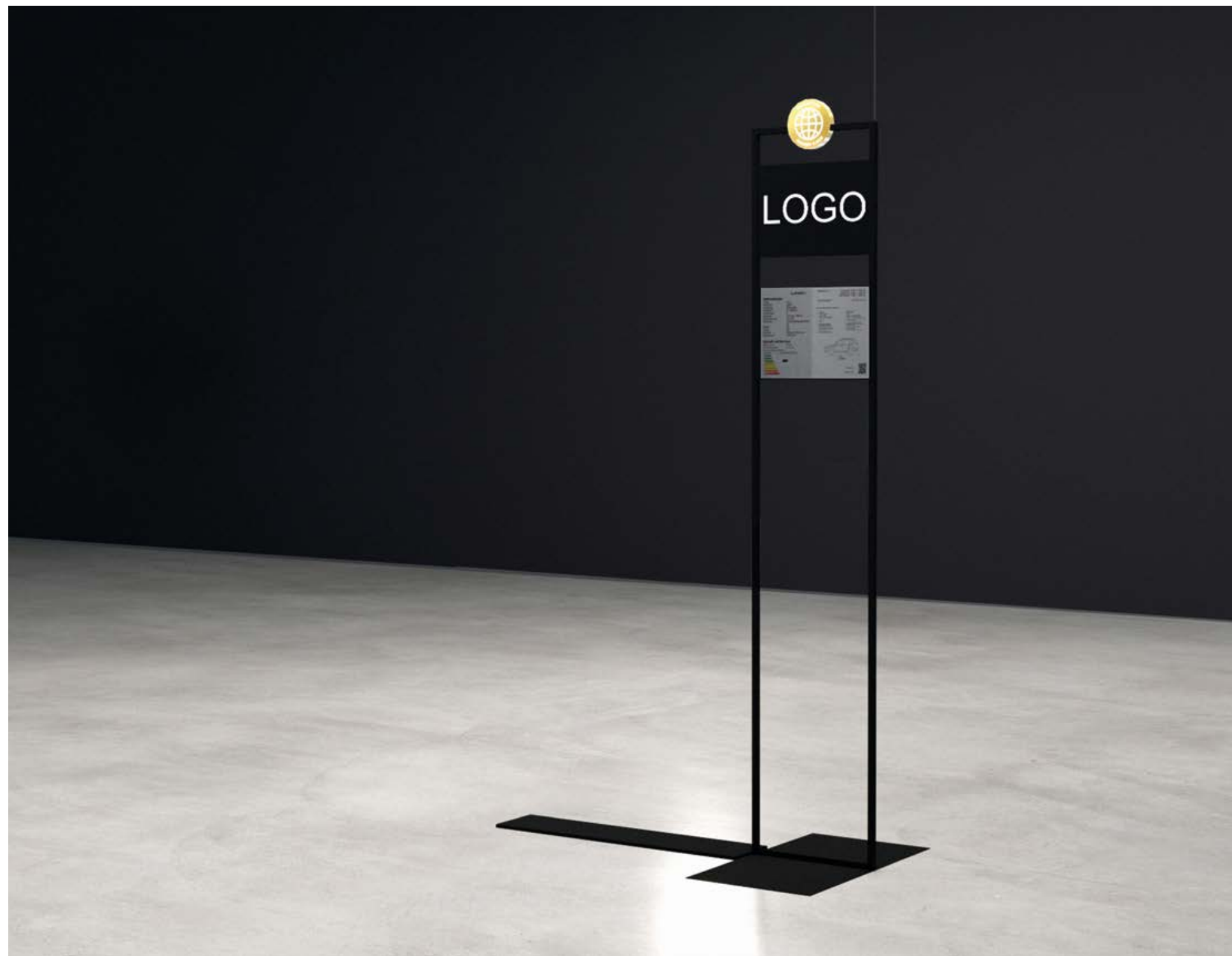
Optionale Stele in der Basiskonfiguration

Die optionalen Stelen verbinden Funktionalität mit filigranem Design, das den Blick auf die Exponate aus keiner Sichtachse stört.