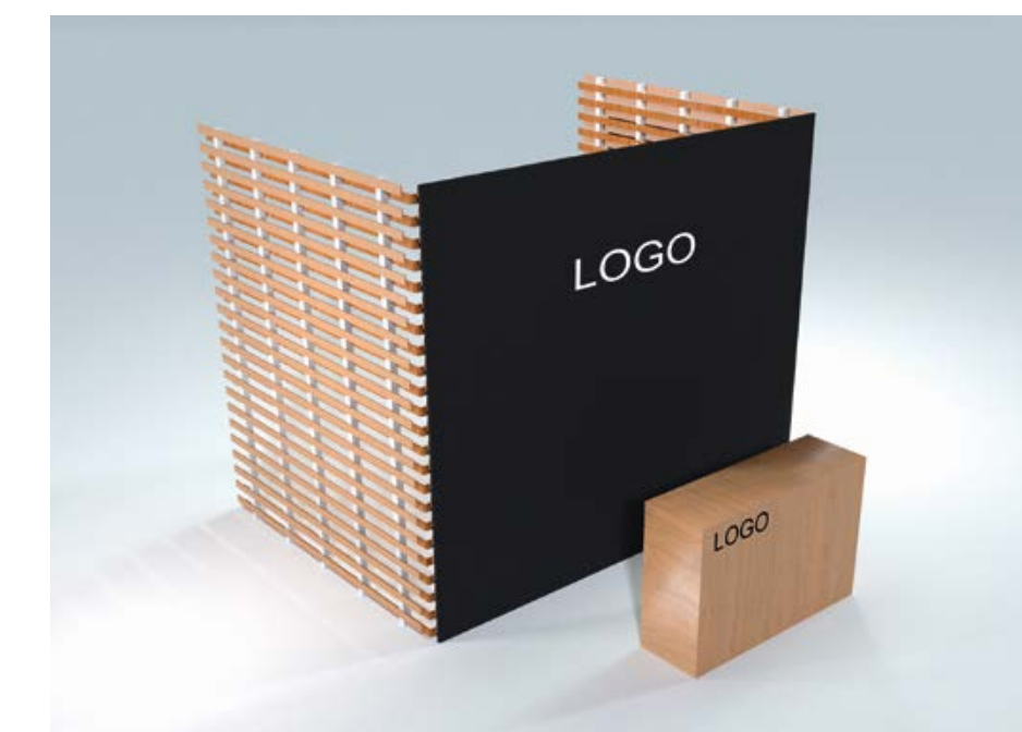
Optionales Countermodul II