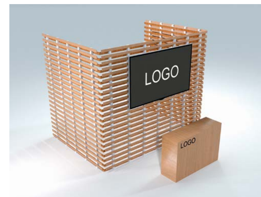
Optionales Countermodul I

Optional erhältliche Module ermöglichen, die Fernwirkung durch Monitore zu verbessern und noch grössere Kommunikationsflächen zu schaffen.