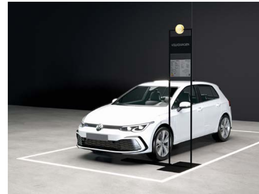
Optionale Bodenmarkierung für konventionelle Antriebe