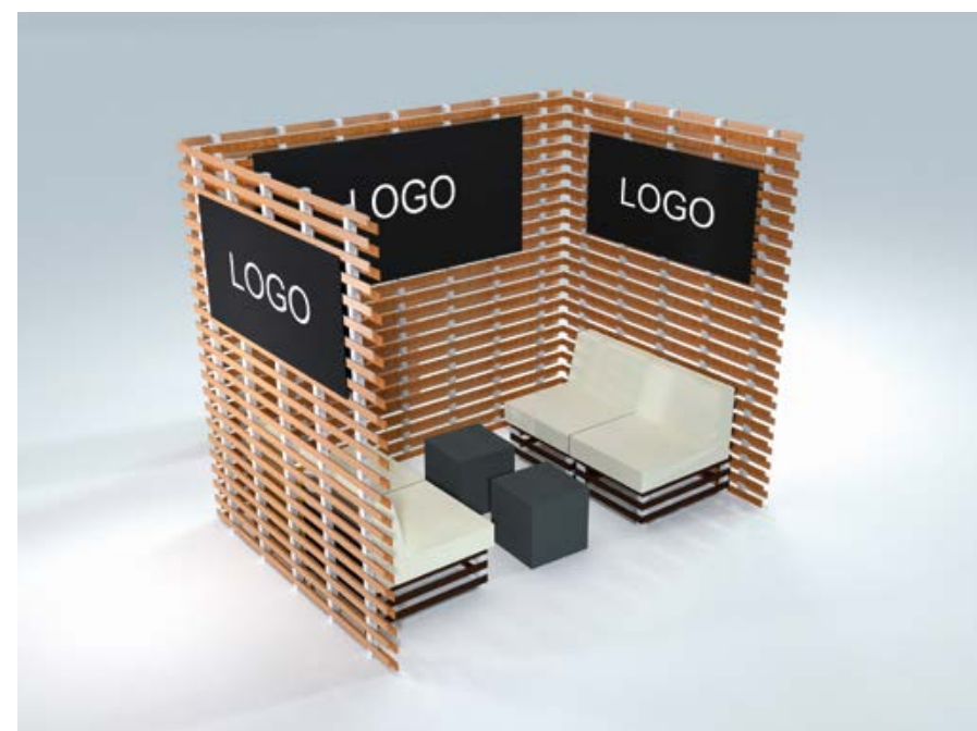
Optionales Besprechungsmodul I

In der Grundausstattung des Standes ist selbstverständlich auch eine Besprechungsgarnitur enthalten.