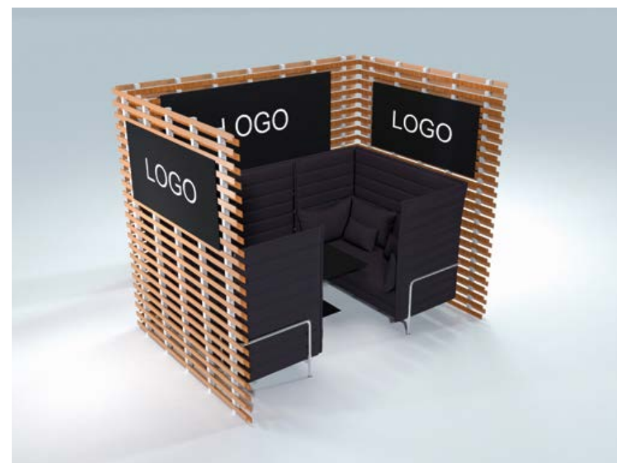
Optionales Besprechungsmodul II

Für noch mehr Diskretion und Komfort bei Gesprächen mit Kunden und Interessenten stehen optional die Besprechungsmodule I & II zur Verfügung.