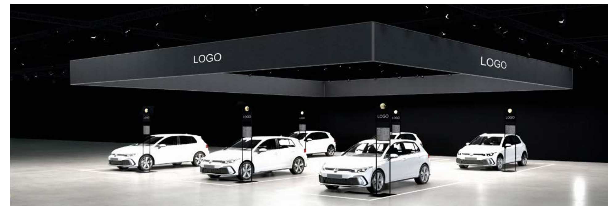
Optionales Zusatzpaket für die Deckenkommunikation