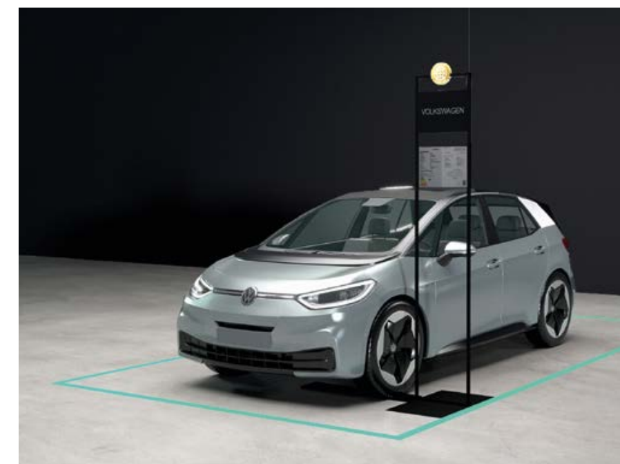
Optionale Bodenmarkierung für elektrische Antriebe