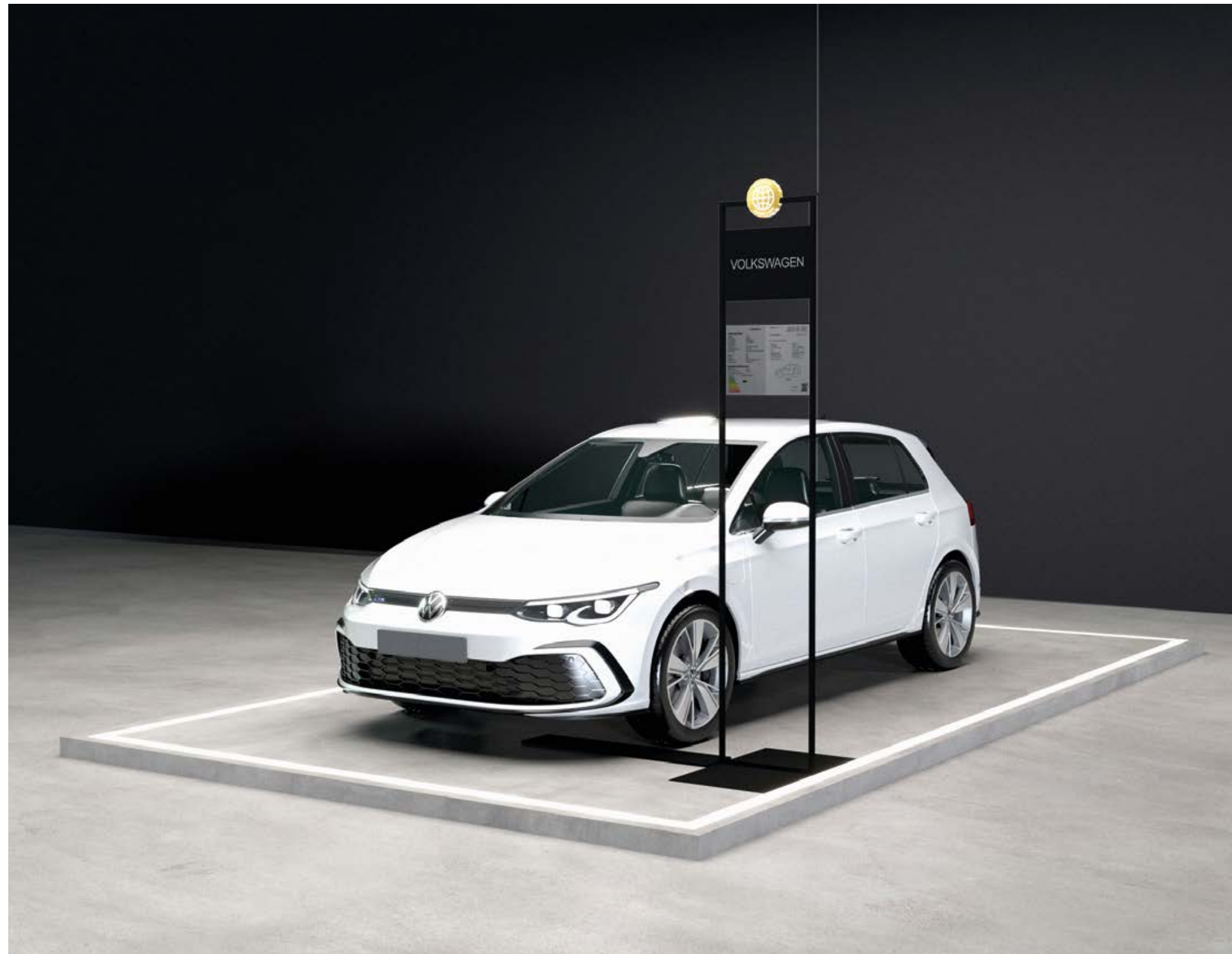
Optionaler Bodenaufbau in Form eines Podestes

Selbstverständlich berücksichtigt das Messebaukonzept auch den Wunsch vieler Aussteller, einzelne Exponate durch Podeste und ähnliche Sonderkonstruktionen besonders hervorzuheben.